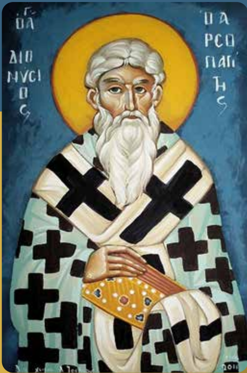
Ο Άγιος Διονύσιος ο Αρεοπαγίτης